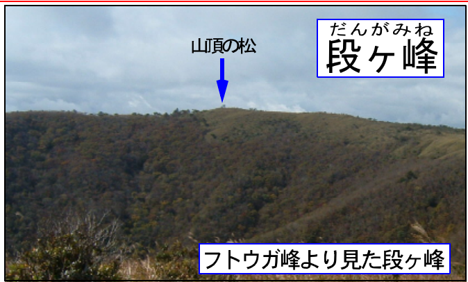
だんがみね 段ヶ峰