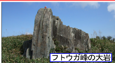
フトウガ峰の大岩