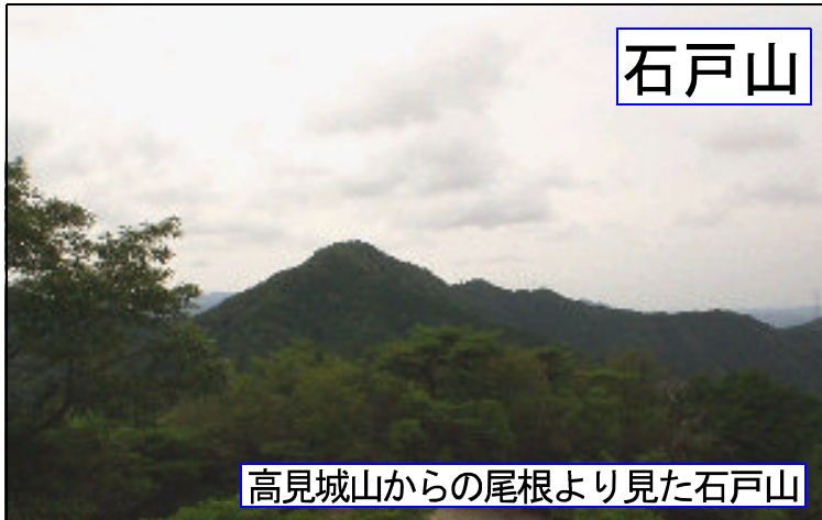
高見城山からの尾根より見た石戸山