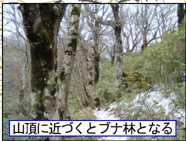
山頂に近づくとブナ林となる

山頂からの展望は良く、北は氷ノ山まで見える。山頂付近のブナ林も氷ノ山を思わせる雰囲気がある。