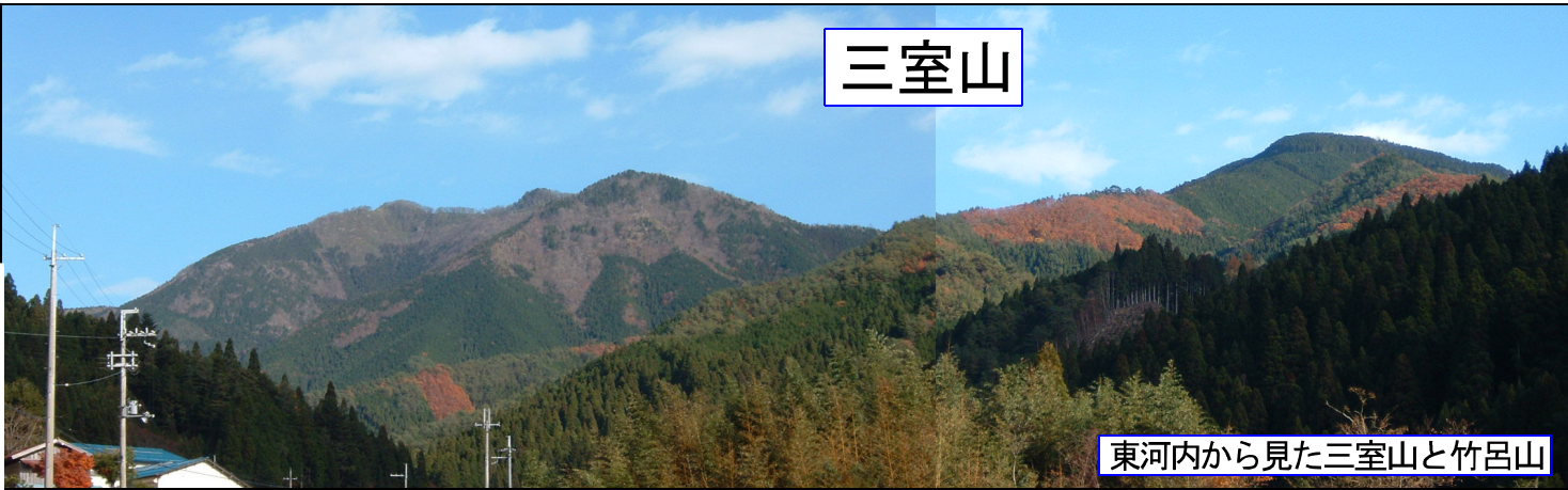
東河内から見た三室山と竹呂山

山頂からの展望は良く、北は氷ノ山まで見える。山頂付近のブナ林も氷ノ山を思わせる雰囲気がある。