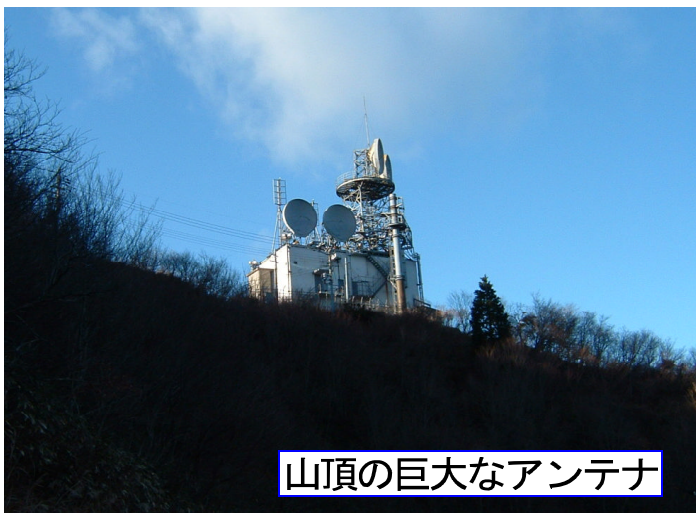
山頂の巨大なアンテナ