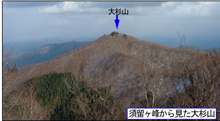
須留ヶ峰から見た大杉山