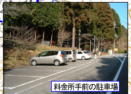
料金所手前の駐車場