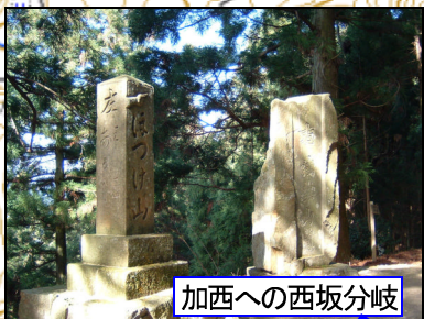
加西への西坂分岐