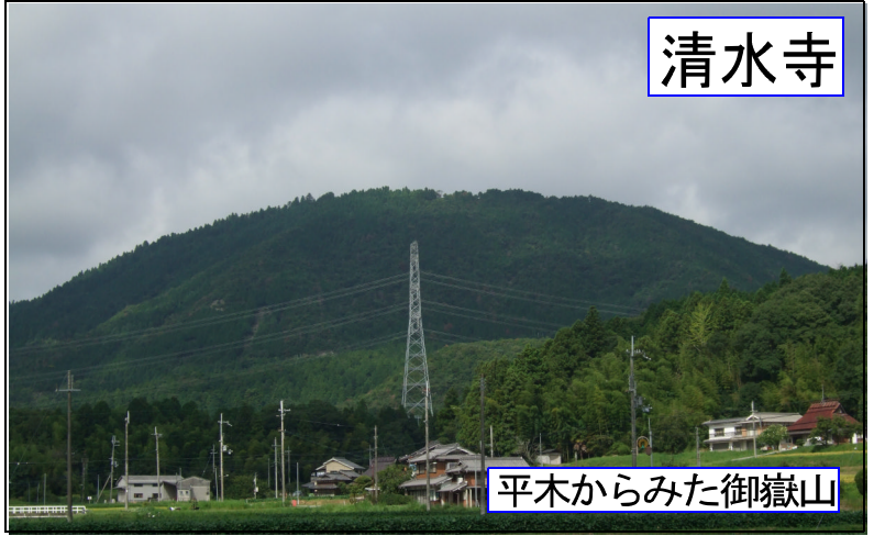
平木からみた御嶽山

小野から社へ「社道池」を右折 国道 372 号「上鴨川」を右折 ゴルフ場前を通過 清水寺の案内板で左に進むと料金所が見える