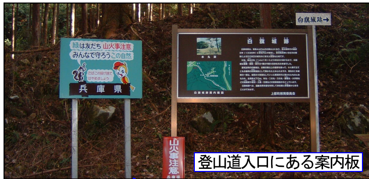
登山道入口にある案内板