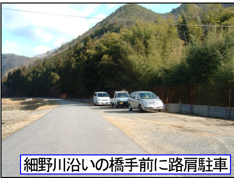
細野川沿いの橋手前に路肩駐車