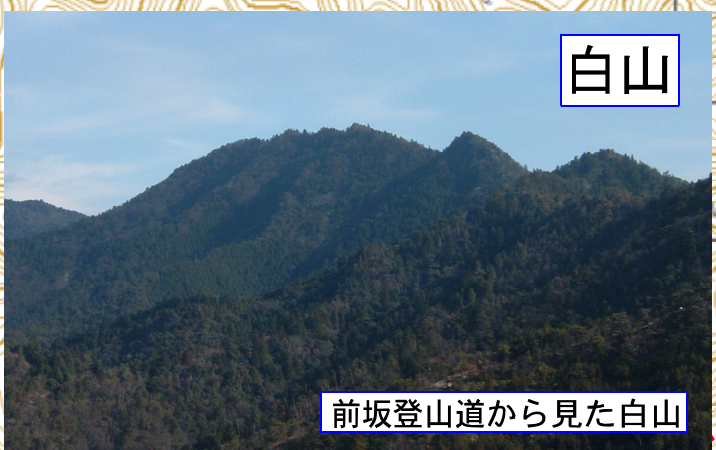
前坂登山道から見た白山