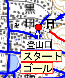
登山口 スタート ゴール

小野から国道175号を北上、黒田庄の畑瀬橋を右折、津万井を左折 大門は直進、黒田庄郵便局前を進むと右に大歳神社が現われる。 駐車は左下の隣保館に駐車してもよいとのことで、そこに駐車す