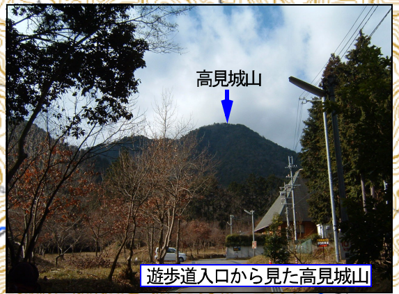
遊歩道入口から見た高見城山