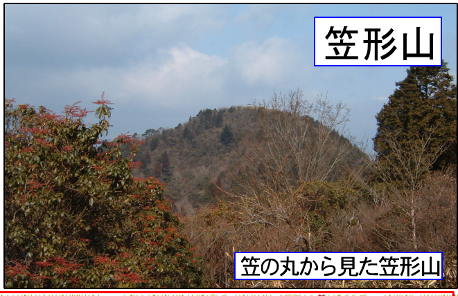
笠の丸から見た笠形山