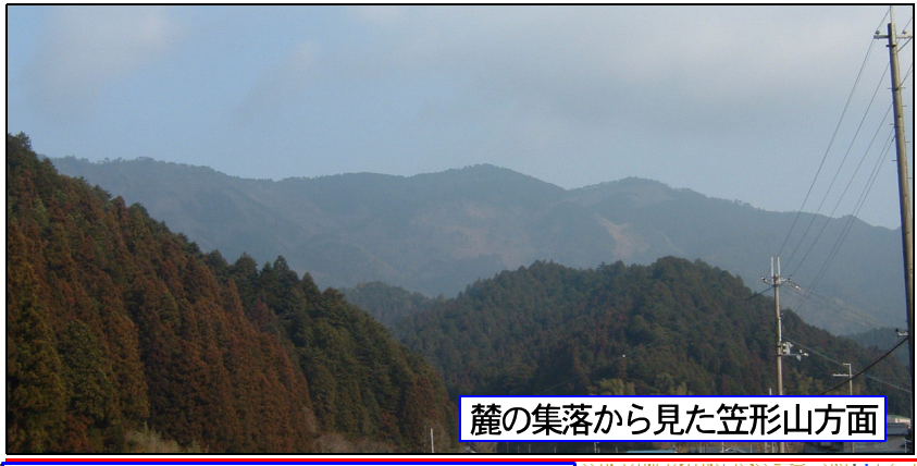
麓の集落から見た笠形山方面