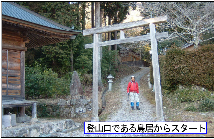
登山口である鳥居からスタート