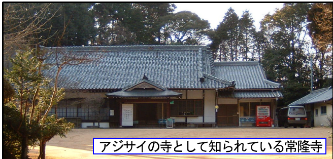
アジサイの寺として知られている常隆寺