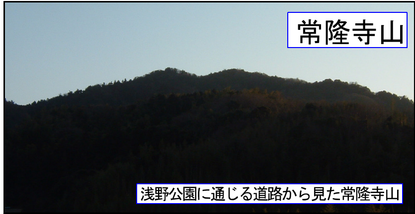
浅野公園に通じる道路から見た常隆寺山

北淡インターで下車、育波橋を右折、浅野バス停先にある歴史民族資料館の案内板を見て右折、あとは常隆寺の案内板が指示してくれる。