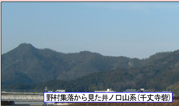
野村集落から見た井ノ口山系(千丈寺砦)

戦国動乱のかずかずの歴史を秘めながら400年余りの風雪に耐え、城跡は今、静かな陽の中にある、と黒井城跡のパンフレットにあった