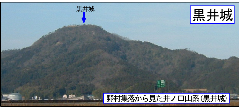
野村集落から見た井ノ口山系(黒井城)