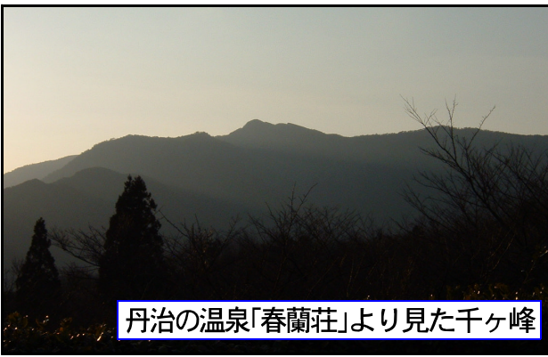
丹治の温泉「春蘭荘」より見た千ヶ峰