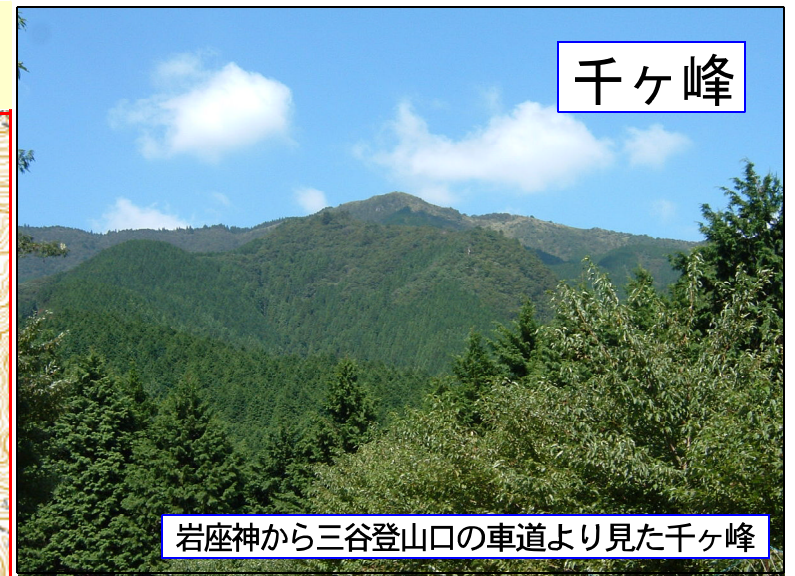
岩座神から三谷登山口の車道より見た千ヶ峰

岩座神登山口・加美町豊部で「千ヶ峰登山口」の標示に従い左折 そのまま進むと登山口