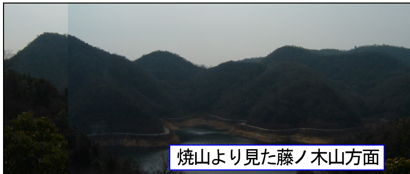
焼山より見た藤ノ木山方面

小野から福岡を通り国道372へ「善防を右折香寺方面117号へ」「西山田を左折」牧野自然公園標識で左折直進でP