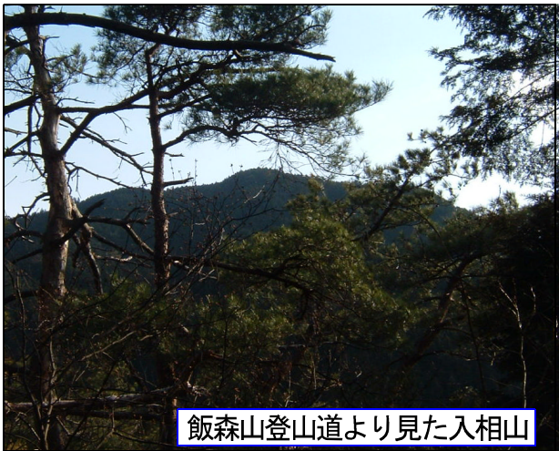
飯森山登山道より見た入相山