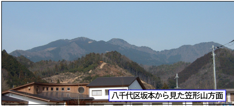
八千代区坂本から見た笠形山方面