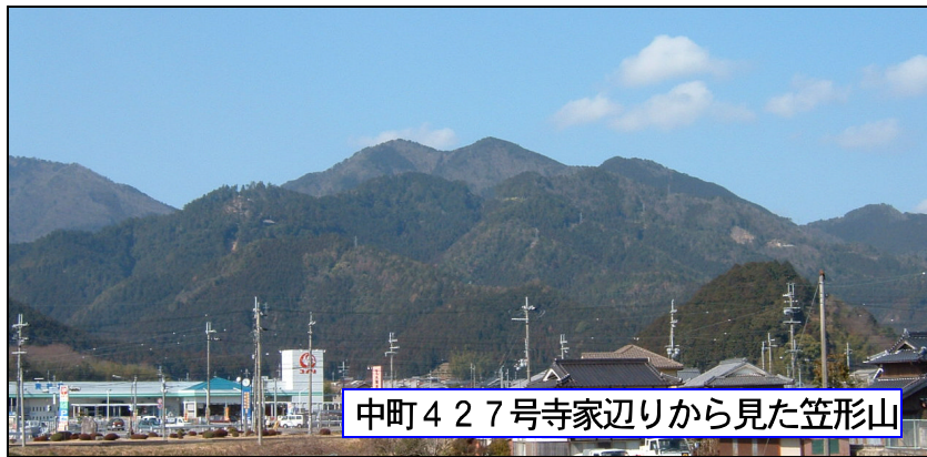
中町427号寺家辺りから見た笠形山