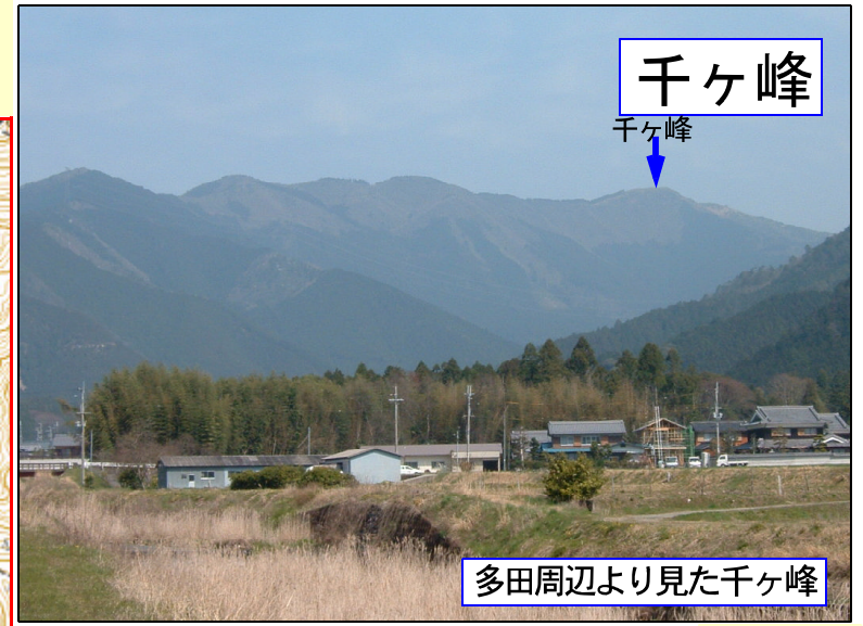
多田周辺より見た千ヶ峰

岩座神登山口へは、七不思議登山口から歩いて仁王門・神光寺の境内を経て「千本杉登山口」に行ける