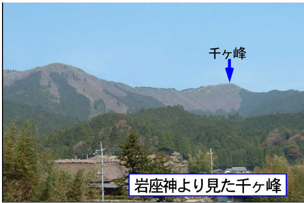
岩座神より見た千ヶ峰