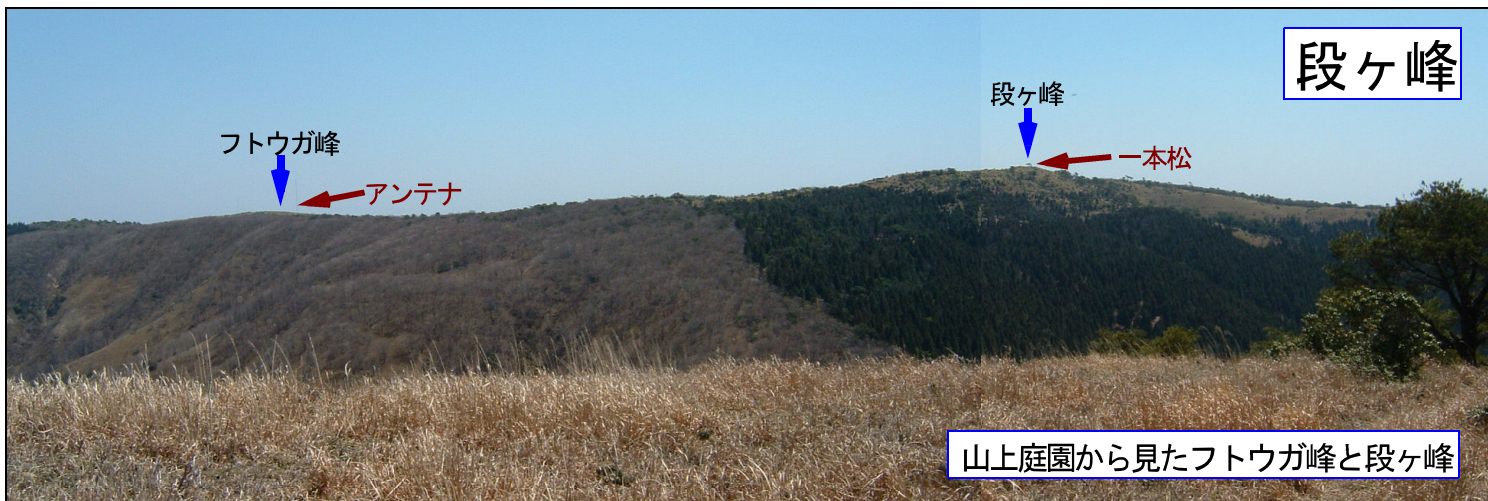
山上庭園から見たフトウガ峰と段ヶ峰

国道29号を北上、一宮町で安積橋を右折、429号、百千家満を右折、「ぶしの村」・上千町から山道を約2kmで登山口