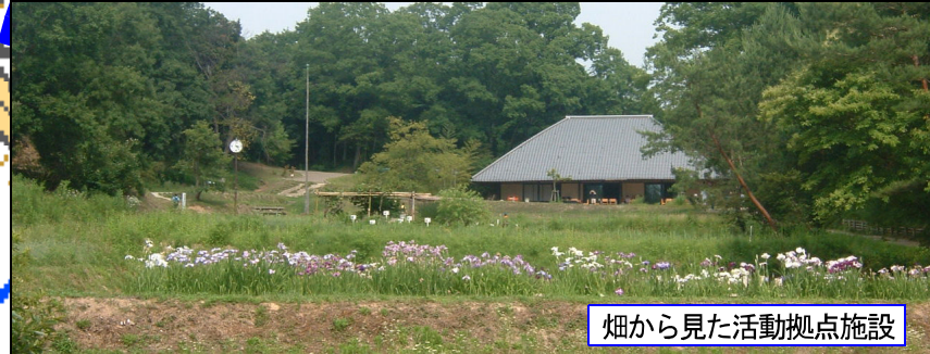
畑から見た活動拠点施設