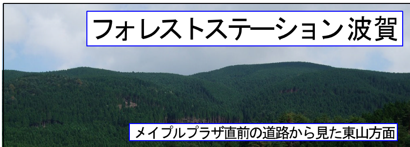
メイプルプラザ直前の道路から見た東山方面