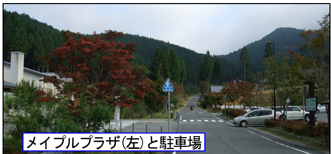
メイプルプラザ(左)と駐車場