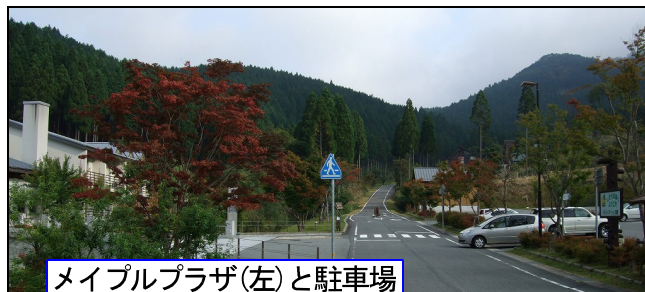
メイプルプラザ(左)と駐車場