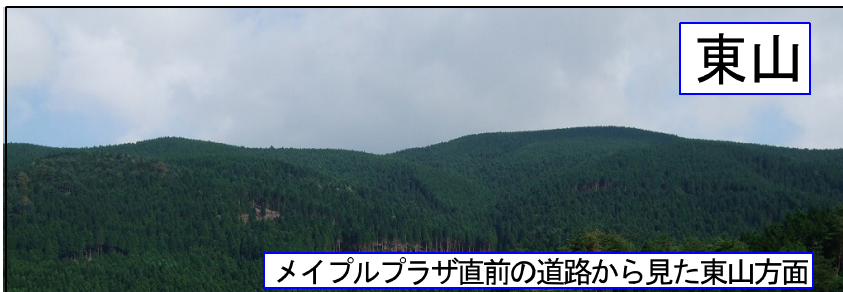
メイプルプラザ直前の道路から見た東山方面