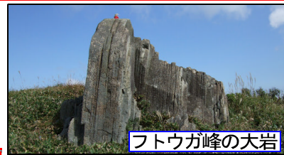
フトウガ峰の大岩