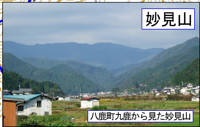
八鹿町九鹿から見た妙見山