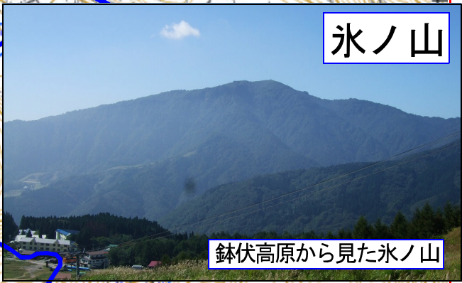
鉢伏高原から見た氷ノ山