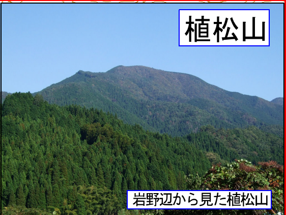
岩野辺から見た植松山