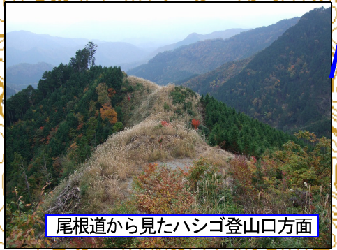
尾根道から見たハシゴ登山口方面