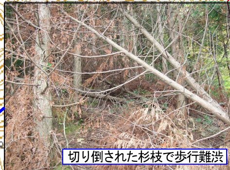
切り倒された杉枝で歩行難渋