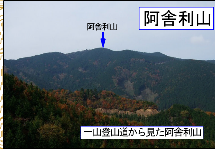
一山登山道から見た阿舍利山