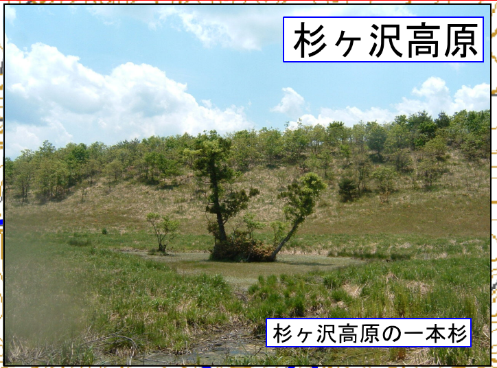
杉ヶ沢高原の一本杉