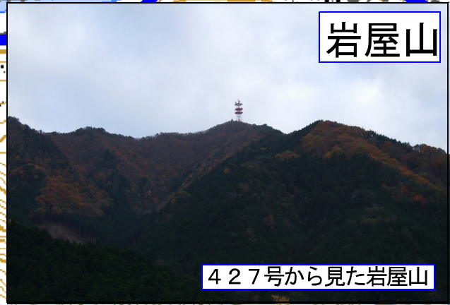
427号から見た岩屋山