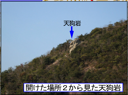
開けた場所2から見た天狗岩