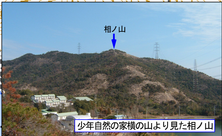
少年自然の家横の山より見た相ノ山