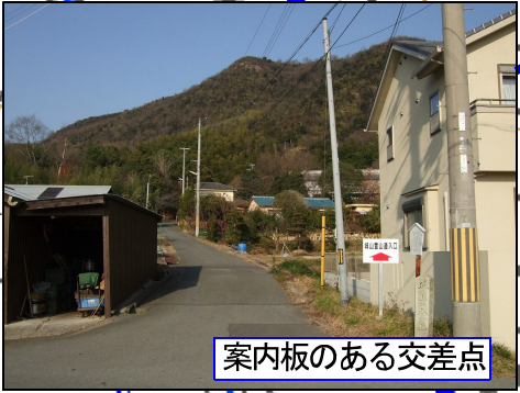
案内板のある交差点