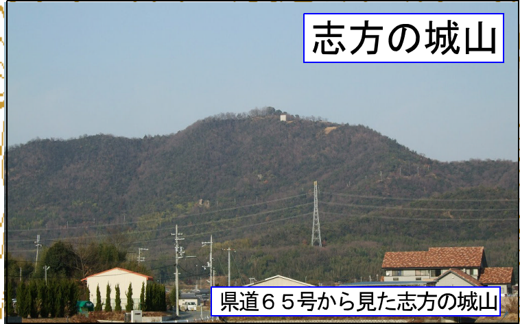
県道65号から見た志方の城山