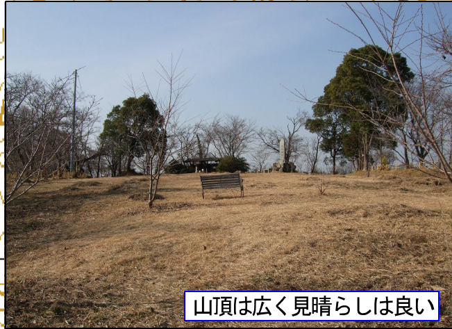
山頂は広く見晴らしは良い