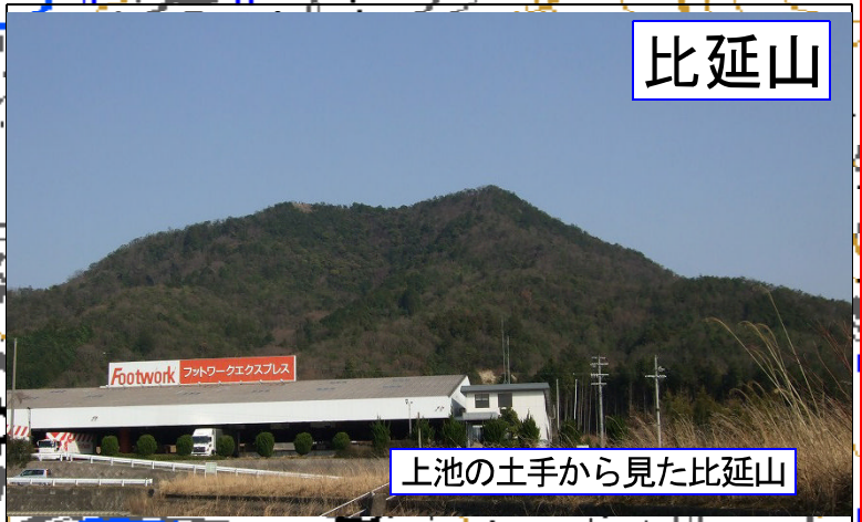
上池の土手から見た比延山