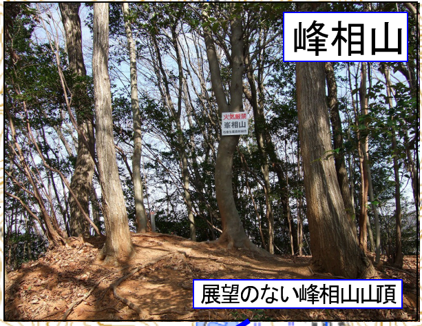
展望のない峰相山山頂