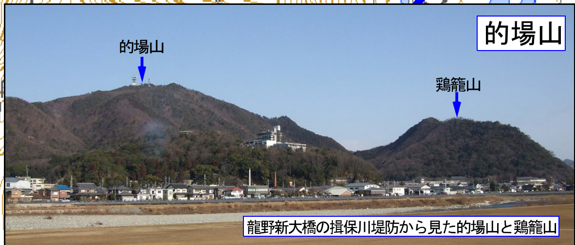
龍野新大橋の揖保川堤防から見た的場山と鶏籠山