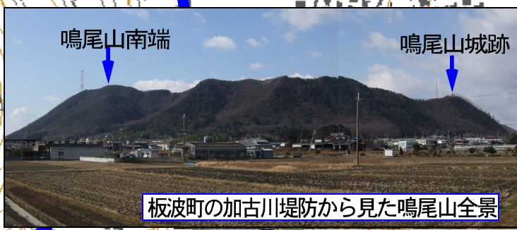
板波町の加古川堤防から見た鳴尾山全景