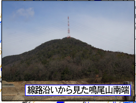
線路沿いから見た鳴尾山南端

国道175号を北上、西脇市に入り板波橋東詰を左折、板波を直進、線路を越えて突き当りを左折、そのまま突き進むと保育園があり右に曲がると保育園の駐車場。