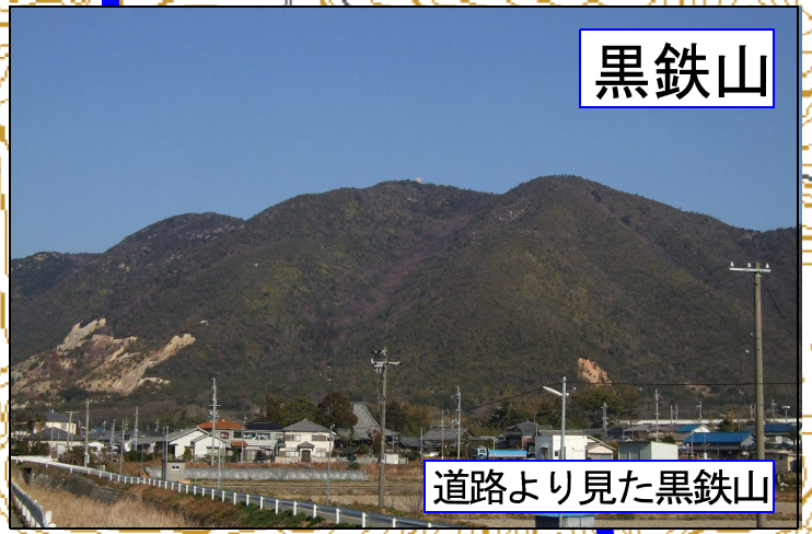
道路より見た黒鉄山