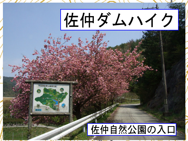
佐仲自然公園の入口