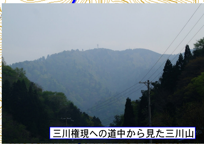
三川権現への道中から見た三川山