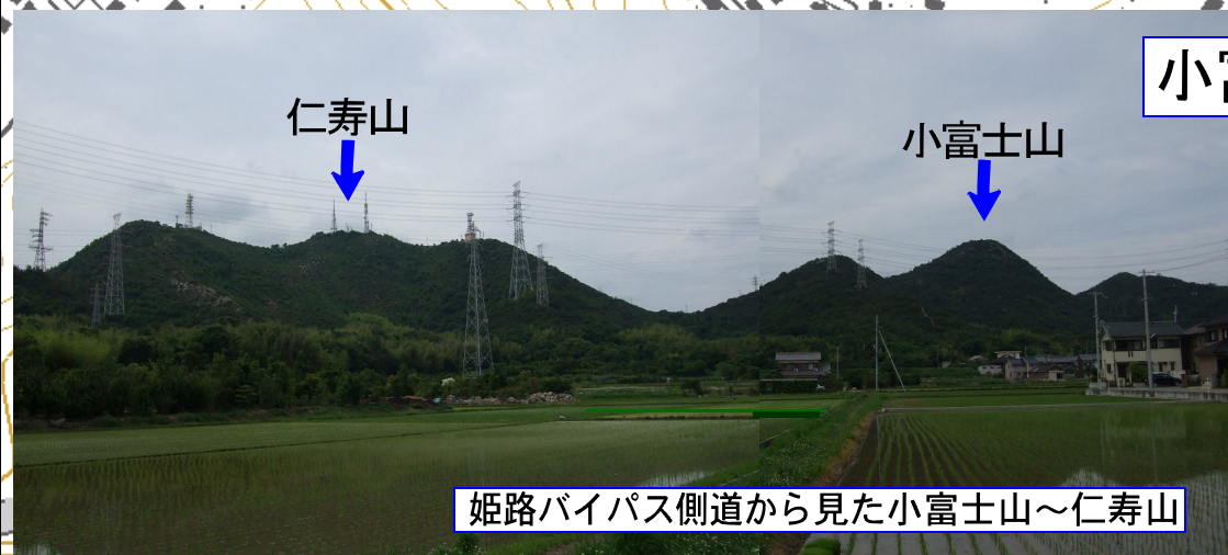
姫路バイパス側道から見た小富士山～仁寿山