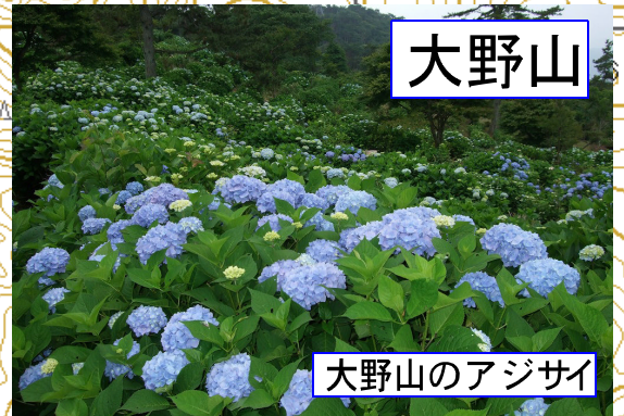
大野山のアジサイ