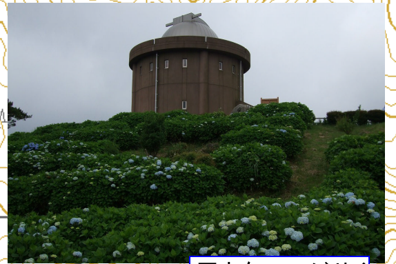
天文台のアジサイ

小野～東条・吉川経由(316号)荒川から三田へ、ゆりのき台を右折あかしあ台4丁目を左折、有馬富士公園口を左折(37号)、木器を右折、県道12号に入り「杉生」交差点を左折、そのまま突き進む。