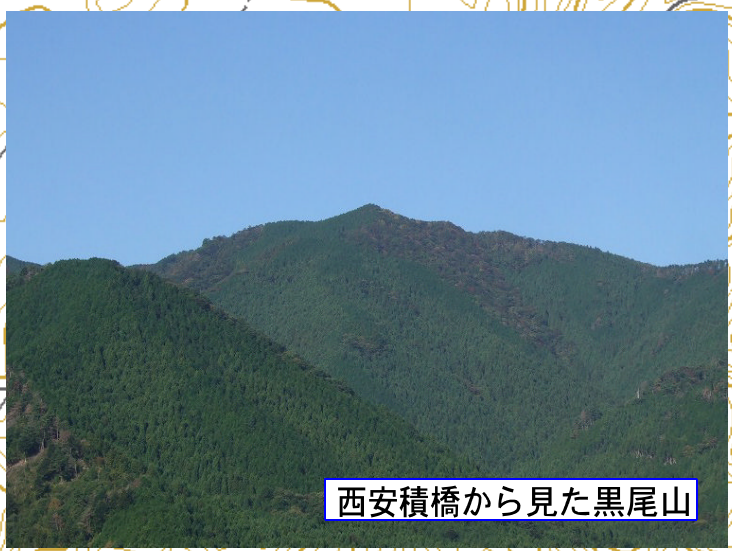
西安積橋から見た黒尾山