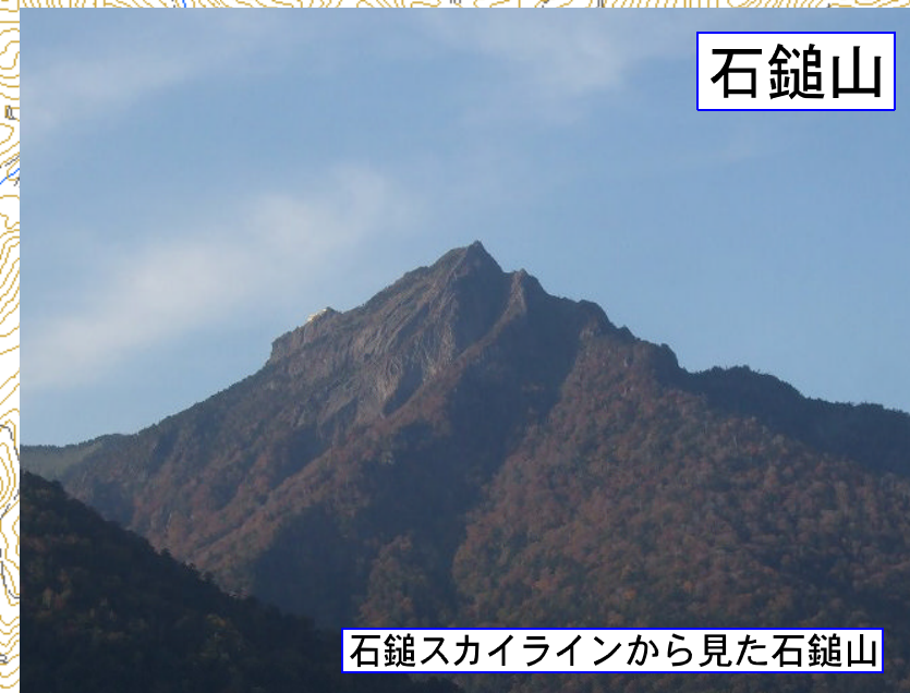
石鎚スカイラインから見た石鎚山