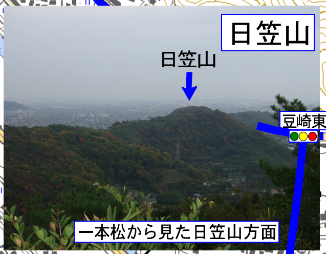
一本松から見た日笠山方面