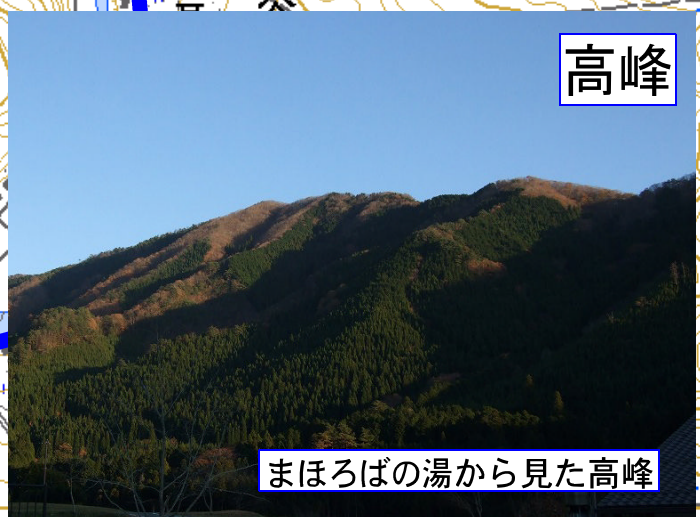
まほろばの湯から見た高峰