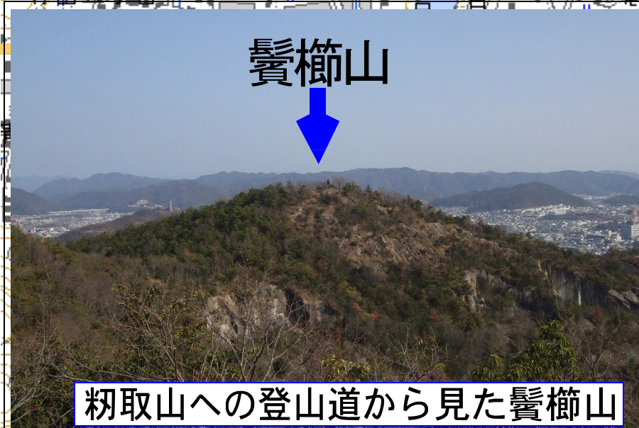
糸取山への登山道から見た鬚櫛山