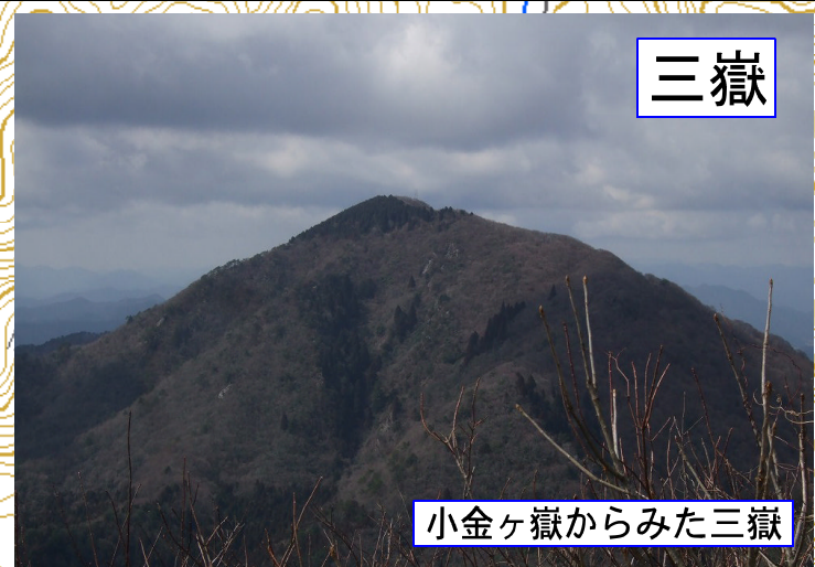
小金ヶ嶽からみた三嶽