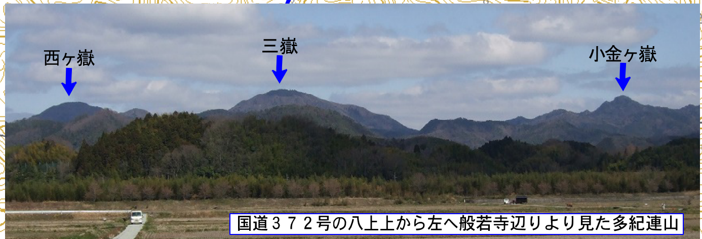
国道372号の八上上から左へ般若寺辺りより見た多紀連山