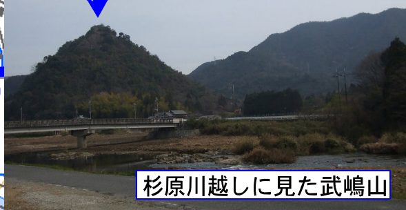
杉原川越しに見た武嶋山